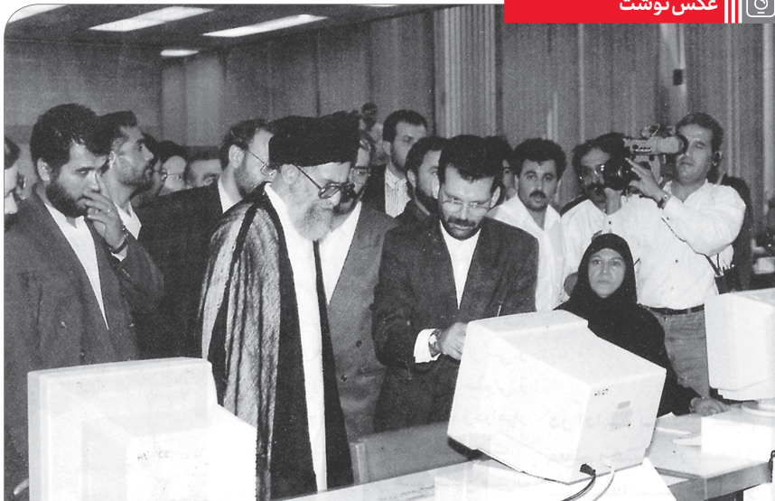
بازدید رهبر انقلاب از سازمان صداوسیما ۲۵/۵/۹۱