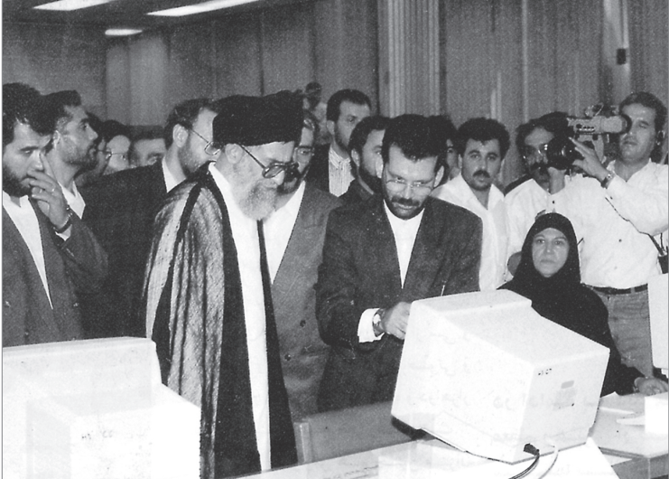
بازدید رهبر انقلاب از سازمان صداوسیما ۹۵/۵/۲۵