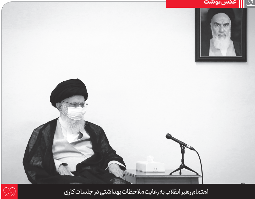
اهتمام رهبر انقلاب به رعایت ملاحظات بهداشتی در جلسات کاری